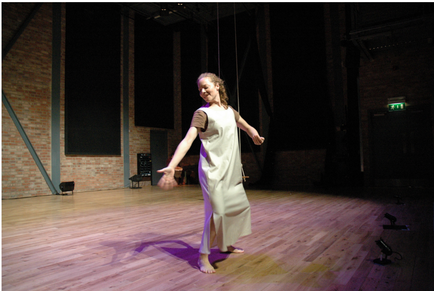
«Куст сирени», 2006 год