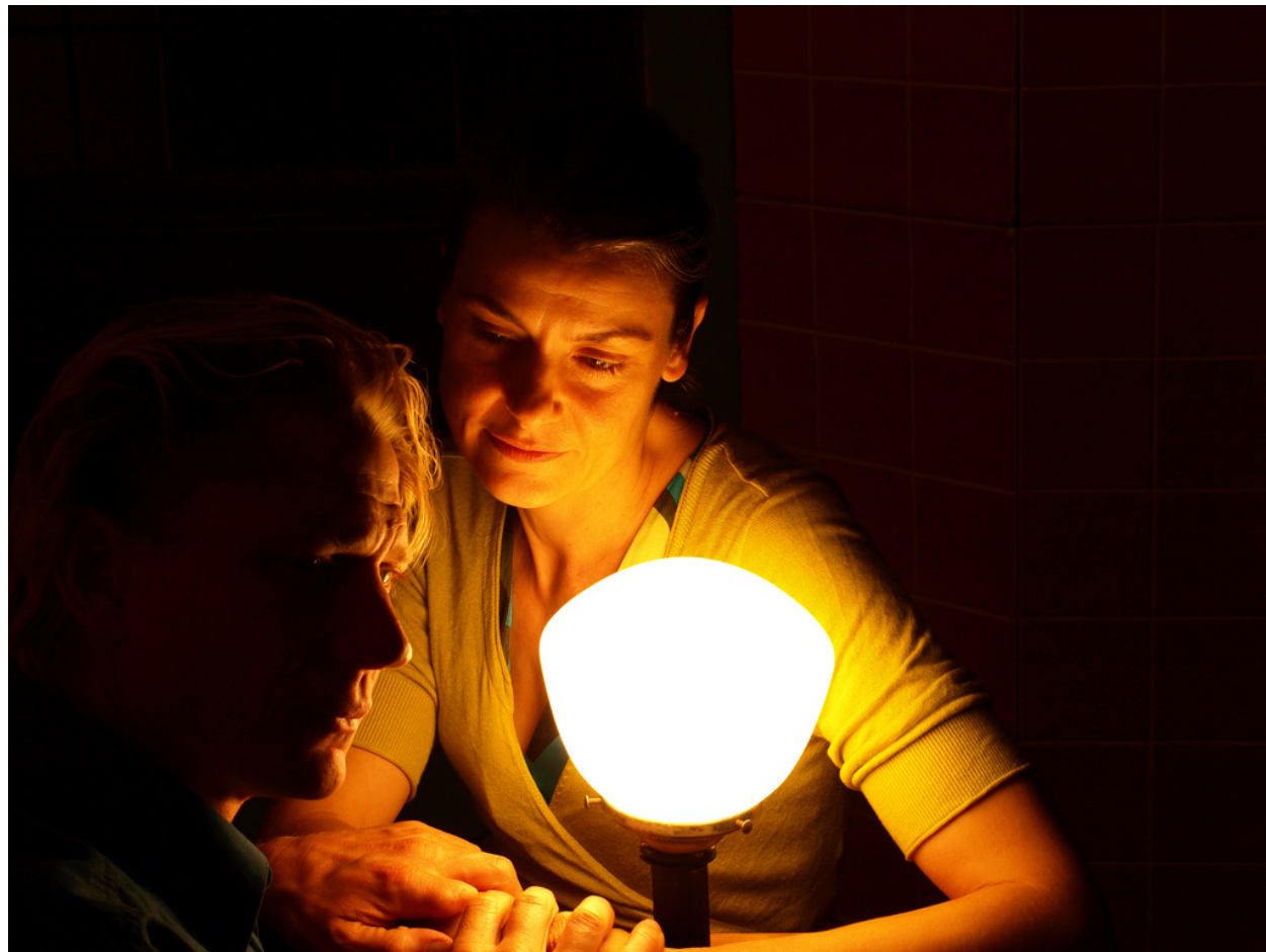
«Переписка», 2004 год