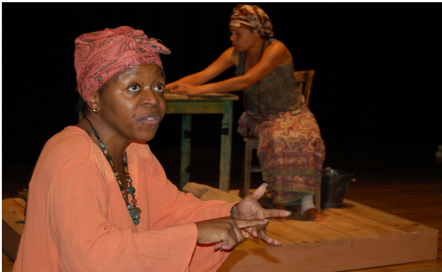
«Слоны в Найроби», 2005 год