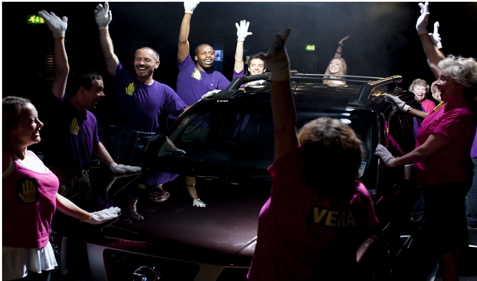
«Держись за свой фургон», 2009 год